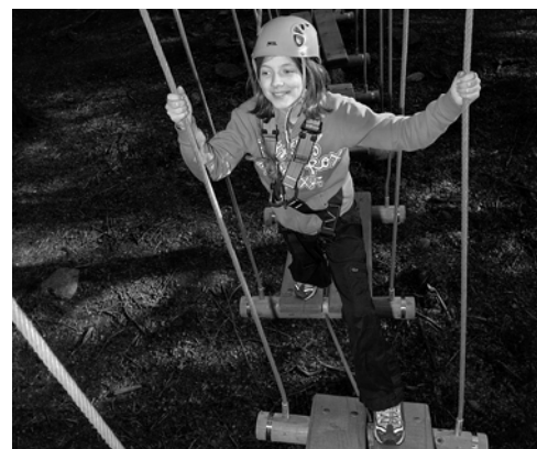
Pob ffotograff di-glod

Yn dilyn cyflwyniad y Safon Cyrsiâu Rhaff Ewropeaidd ym mis Mawrth 2008, mae dogfen sydd yn cynnig arweiniad i weithredwyr, adeiladwyr a hyfforddwyr ayyb. Sydd yn ymglymedig â chyrsiâu rhaff, nawr ar gael gan AAIAC.